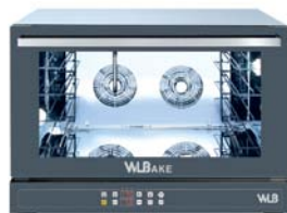
V 443 ER