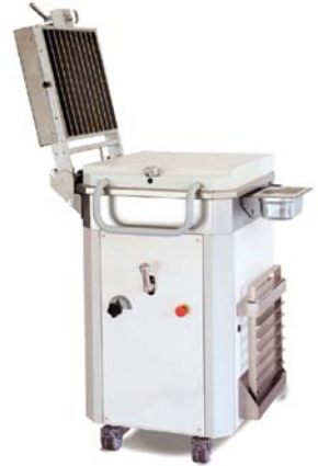
MHD SA 20 T