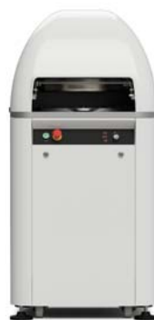
VDR II A 30