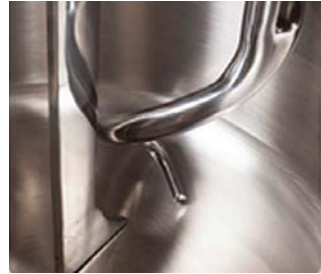
Спираль и отсекатель