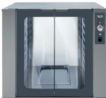
VPF 864 M