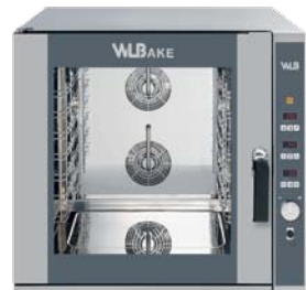
WB 664 ER