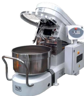
SPR 80 N