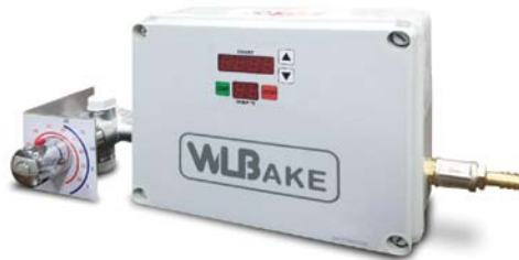
WLD 25 ECO