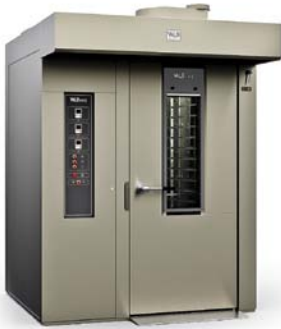
ROTOR FR Smart 60x80 (ЭЛЕКТРОМЕХАНИЧЕСКАЯ ПАНЕЛЬ)