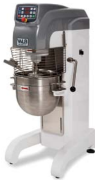
PM 40 EVAR