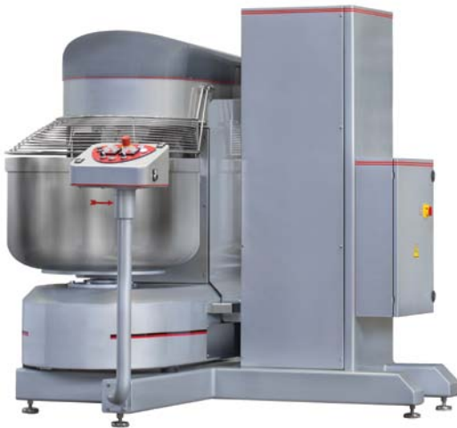
SPOT 120 N