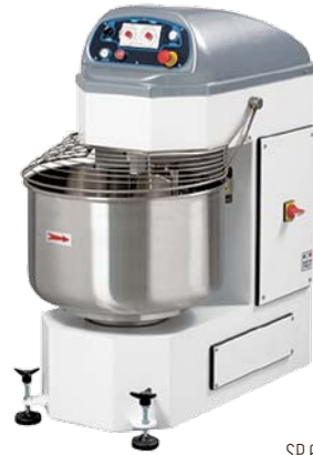
SP 60 ONE