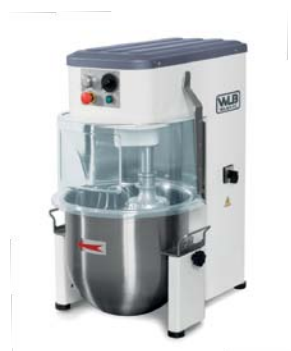
PM 20B VAR