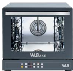
V 464 ER