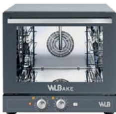
V 464 MR