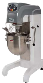
PM 40 VAR