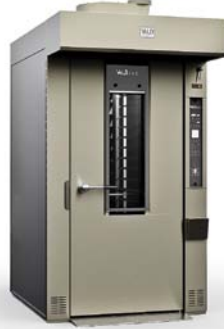
ROTOR PRO 60x80