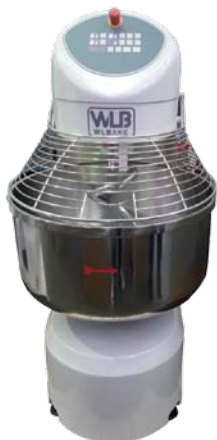
SP 60 N