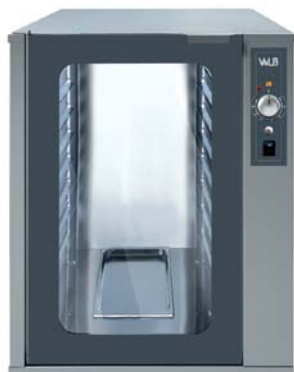
VPF 843 M