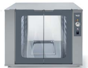
WLIIEV 1264 M