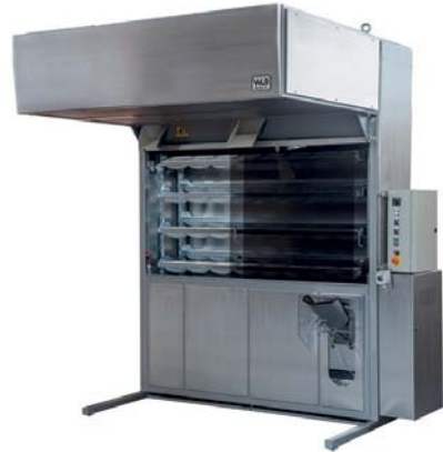
PR 1 216