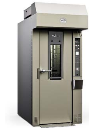
ROTOR SLIM PRO