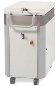
MHD SA 20